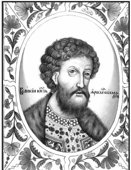
Ярослав Всеволодович. Миниатюра из Царского титулярника

В 1238 году великий князь Ярослав Всеволодович дал в удел своему брату Ивану Всеволодовичу город Стародуб на Клязьме с областью. С конца XVI века Стародуб стал терять своё значение, и к началу XIX века это уже было село Клязьменский Городок Ковровского уезда Владимирской губернии.