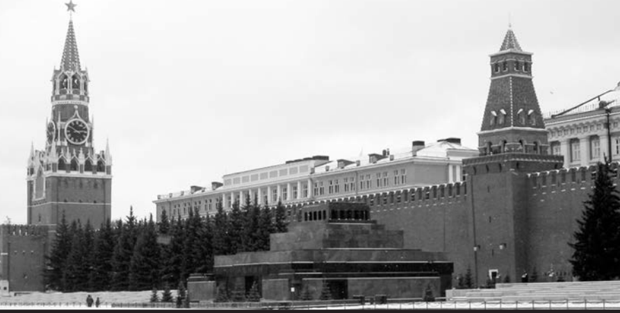
Фото Мавзолея с сайта ЮНЕСКО

По её словам, снижение требований приведёт к увеличению процессуальных ошибок и притоку случайных людей в органы.