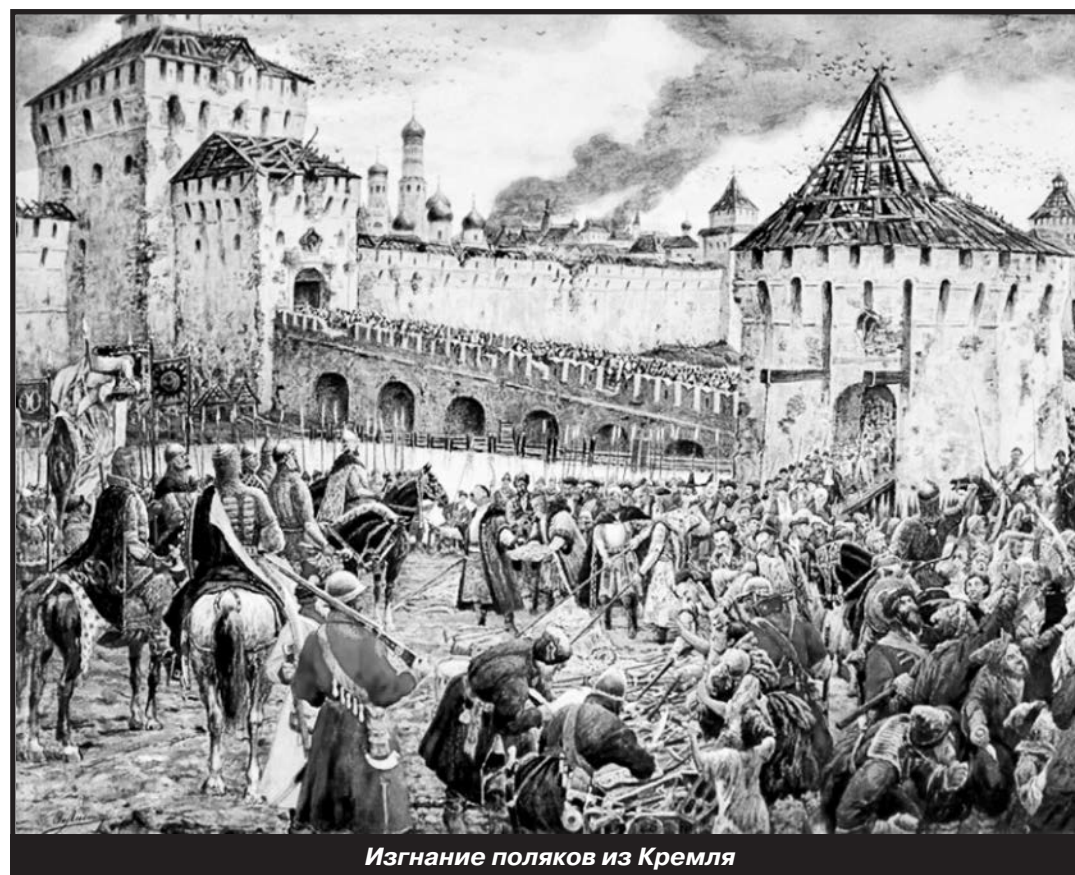
Изгнание поляков из Кремля

Война Нижегородского ополчения с поляками – это элемент бесперспективной гражданской войны, так как за ополчением стоит лишь земская власть Нижнего Новгорода. А когда за ополчением будет стоять государственный аппарат в главе с царём и патриархом, произойдёт коренной перелом в мышлении всего народа. Царь же должен быть избран Земским собором – представителями всех городов Руси, а не пьяными казаками, выдвинувшими уже десятка два самозванцев. Оптимальным местом для проведения такого собора был Ярославль.