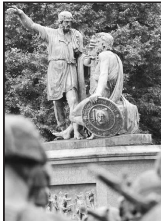
Памятник Кузьме Минину и Дмитрию Пожарскому на Красной площади в Москве

Точку в вопросе о Минине и Пожарском 7 ноября 1941 года поставил Сталин. Выступая с трибуны Мавзолея, он сказал: «Пусть вдохновляет вас в этой войне мужественный образ наших великих предков – Александра Невского, Дмитрия Донского, Кузьмы Минина, Дмитрия Пожарского, Александра Суворова, Михаила Кутузова».