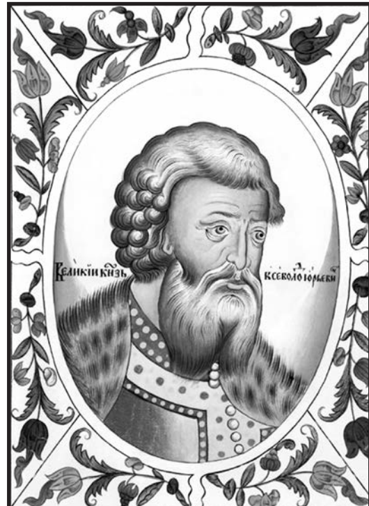
Портрет Всеволода Юрьевича Большое Гнездо из Царского титулярника (1672)

Увы, царские и советские историки сделали из Пожарского незначительного дворянина, храброго и талантливого воеводу, но слабого политика, начисто лишённого честолюбия. Вообще этакого исправного служаку-бессребренника – совершил подвиг, откланялся и отошёл в сторону. Реальный же князь Пожарский ничего не имел общего с таким персонажем.